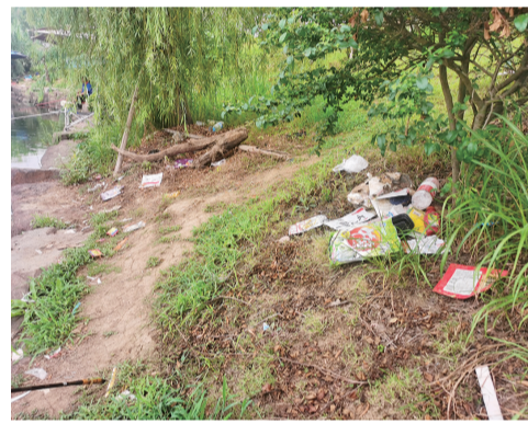
开化江边的“钓鱼垃圾”。

记者联系了属地暨南街道,工作人员表示,公园和堤防工程是由商贸城建管委牵头的,上月通过验收,目前处于养护期。需要松绑的树木由施工方进行处理。江边的垂钓垃圾会继续督促保洁公司加强管理和巡查。