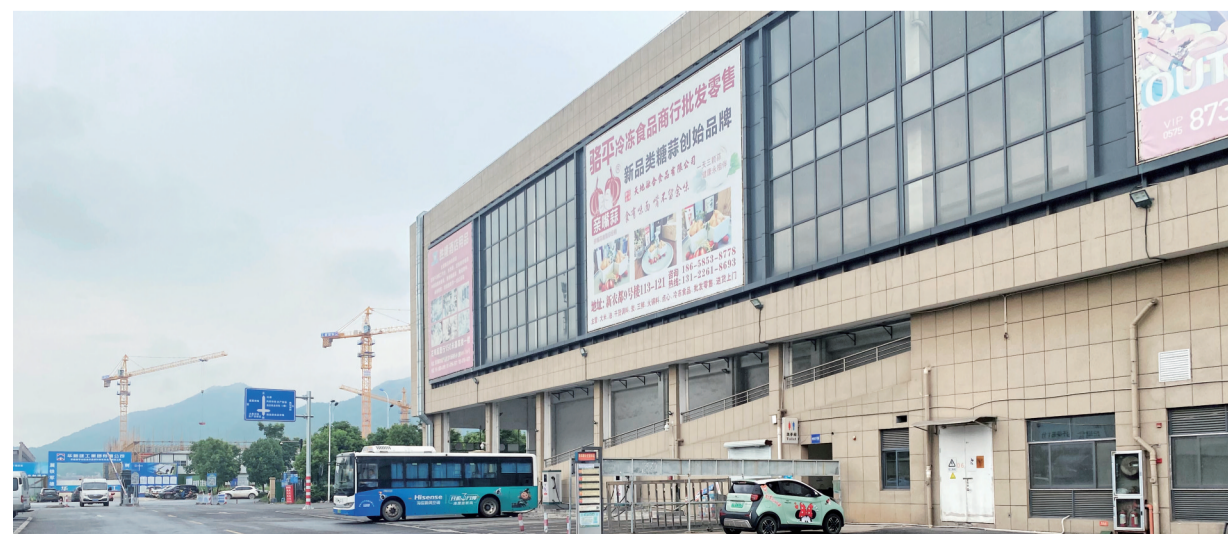
新农都公交首末站尚未设置候车亭。

外,还有32路、53路公交车路经。那该处公交站之后是否会安装候车亭呢?记者将现场情况分别反馈给了市公交公司、市交通局以及新农都诸暨物流中心。后续进展,政民e线直通车也将持续关注。