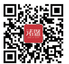
扫一扫下载掌上诸暨

浣东街道:经过了解,公交站台背后的地方属于公路两侧的绿化带区域,村里没有权利擅自进行施工;此外,由于路口到公交站台总共只有10米不到的路程,完全没有必要再增设一条小路。网友如果仍有诉求,可直接向白鱼潭古村两委干部反映。