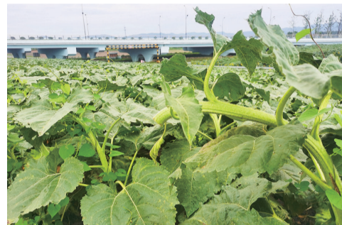
高湖向日葵花海疑遭采摘。