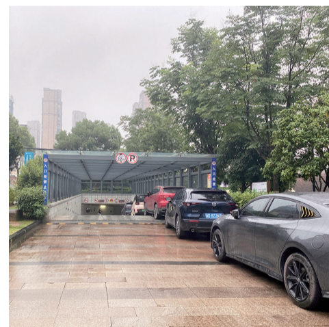
科技馆停车场入口过道上常有车辆停放。

记者从市建设集团了解到,目前停车场实施违停车辆黑名单制度,录入停车系统黑名单的车辆,自违停起6个月内将无法进入停车场,并已在停车场入口处、过道设置告知牌。