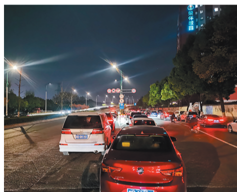
高架口有车辆乱停。

针对上述情况,记者也从市交警大队浣东中队了解到,交警部门已联系学校通知家长靠道路一侧停放,同时加强上下学期间学校及周边路段执勤警力,保障道路通行安全畅通。