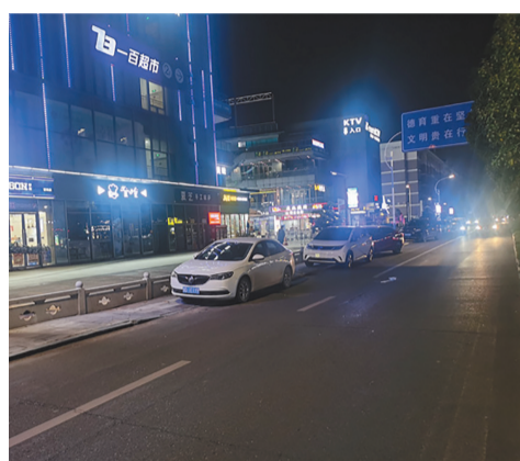
人行道被车辆占用。

“前段时间停着很多车辆,这两天每天都来贴罚单,人行道上城管贴,路边交警贴。”附近小区居民告诉记者。针对上述情况,记者也从浣东街道办事处了解到,近日晚时段,街道已联合市综合行政执法大队浣东中队以及浣东交警中队,对不夜城人行道以及马路上的机动车违停进行巡查和抄告,下一步将继续加强日常管理。