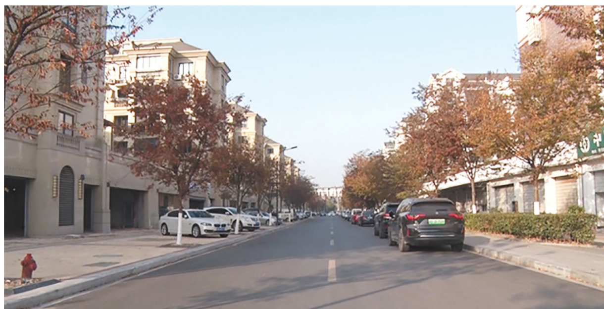
多辆车停在道路两旁。

针对上述情况,记者分别联系了市综合行政执法局与市交警大队,小区东侧人行道车位补划工作将在新的漆化公司到位后进行,杨树畈路目前施划了分隔线并已在路口处设置红绿灯,暂不具备车位施划条件。