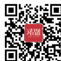
扫一扫下载掌上诸暨

浣东街道:李村一村坞坑自然村的道路破损问题,是由于该道路经常有重型车辆经过,导致道路破损,下一步,街道会联合相关部门对重型车辆进行监管。